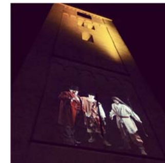
Projectie op Witte Kerk

De bezoekers van de expositie benoemden de kwaliteit en waarden van het dorp zoals rust, groen, ruimte en de ligging. Ook werd aangegeven waar Heiloo in kan worden versterkt, onder andere door meer cultuur, dynamiek en verjonging. De tentoonstelling heeft bekendheid gegeven aan de start van de Toekomstvisie Heiloo en is bezocht door ongeveer 500 mensen.