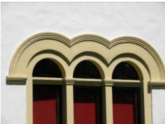
Detail dienstwoning Nijenburg

Voor de concretisering van deze gestelde doelen worden in hoofdstuk 5 instrumenten aangereikt.