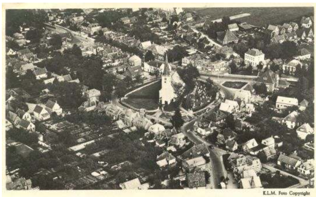
Centrum rond de Witte Kerk kort na de Tweede Wereldoorlog

Tussen de beide wereldoorlogen in, is Heiloo uitgegroeid als forenzenplaats. In deze eerste groeiperiode, werden aanvankelijk alleen de historische linten volgebouwd. Na de Tweede Wereldoorlog werd de ruimte vraag zo groot, dat voor het eerst buiten de historische linten, in de lager gelegen strandvlaktes, werd gebouwd (Plan Oost en West). Daarbij werd altijd zorgvuldig aangesloten op het landelijke en groene karakter. Dit uitte zich o.a. door in de stedenbouwkundige aanleg te kiezen voor een ruime opzet met groene bermen, die de overgang tussen openbaar en privégebied verzachten.