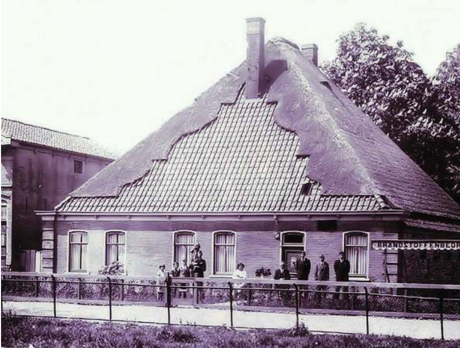
Westerweg: Inmiddels gesloopte stolp op de hoek van de Pastoor van Muijenweg met opmerkelijke dakspiegel

Bescherming en zoveel mogelijk herbestemmen van stolpen is het streven. Voor moeizame processen wordt de provincie ingeschakeld; dit is haar beleid omdat zij het belang van stolpen van groot belang acht voor Noord-Holland.