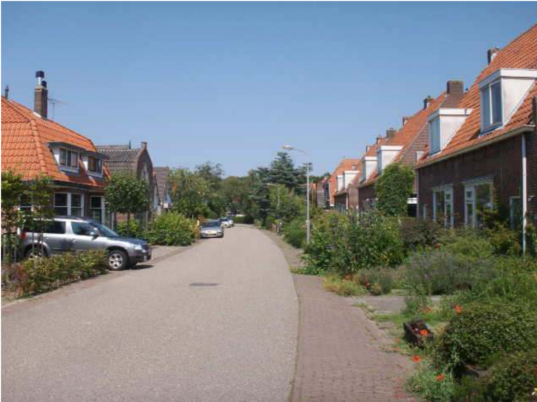
Kenmerkende lintbebouwing langs de Nicolaas Beetsweg

Bescherming en eventuele herbestemming van bestaande waardevolle bebouwing is belangrijk (zij bijlage 3 en 4). De kwaliteit en individualiteit moet uitgangspunt zijn voor het toevoegen van nieuwe bebouwing.