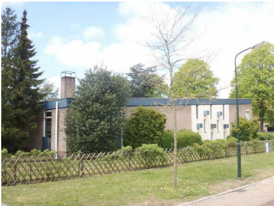
Het voormalige wijkgebouw met woning uit 1966 is een karakteristiek pand als voorbeeld van wederopbouwarchitectuur

In het kader van de Welstandsnota is een lijst opgesteld van karakteristieke panden. De vermelde panden onderscheiden zich op een positieve manier van de algemene bebouwing van Heiloo en dragen bij aan de hoge ruimtelijke kwaliteit. De panden op deze lijst worden vanwege hun waarde aan de Cultuurhistorische Waardenkaart toegevoegd. De lijst in de Welstandsnota dient als kwaliteitslijst van waardevolle bebouwing, heeft niet de juridische status van een gemeentelijke monumentenlijst, maar wordt gezien als signaallijst bij ingrijpende veranderingen.