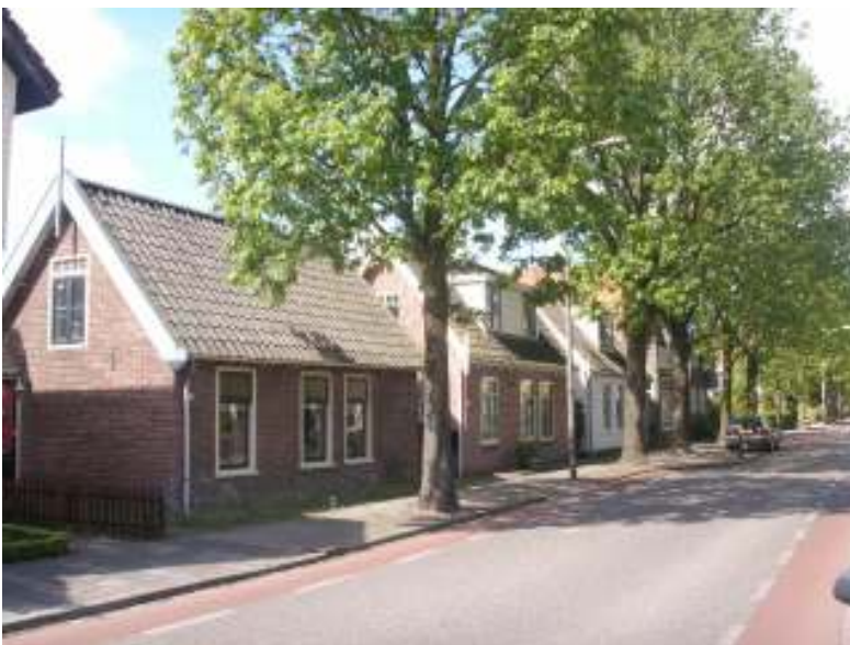
Kerkelaan: efficiënte plaatsing op de kavels van de vroegere tuinderhuisjes parallel aan de weg

In deze inleiding (hoofdstuk 1) wordt een beeld gegeven waarom een nieuwe nota Cultuurhistorie op dit moment nodig is. Omdat de nadruk van deze nota ligt op de identiteit van Heiloo wordt in hoofdstuk 2 een korte schets en analyse van de historische groei van Heiloo gegeven, waarbij de belangrijkste identiteitsdragers van Heiloo worden genoemd. In het derde hoofdstuk wordt de visie op cultuurhistorie verwoord en de bijbehorende doelen geschetst. Het vierde hoofdstuk omvat het voorgestelde beleid, waarvoor de noodzakelijke instrumenten in hoofdstuk 5 worden verwoord. In hoofdstuk 6 is per instrument een beknopt overzicht gegeven van de voorgestelde instrumenten, met een planning, de benodigde tijdsbelasting en de kosten. In het voortraject is een keuzemogelijkheid ingebouwd door twee scenario's te schetsen in hoofdstuk 7. De beide scenario's zijn benoemd, zodat duidelijk is dat er een bewuste keus gemaakt is. Een afrondend hoofdstuk 8 waarin het verschil tussen de oude en de nieuwe situatie wordt verwoord, gaat dan vooraf aan een aantal bijlagen, waarin o.a. de context van rijks- en provinciaal beleid, maar ook reeds bestaand gemeentelijk beleid, met name voor wat betreft de archeologie, wordt geschetst.