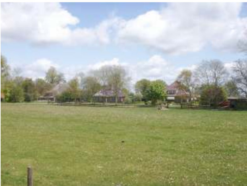
Buurtschap Oosterzij: gelegen op de strandwal: droog wonen; het vee graasde op de omliggende weilanden

Ook veebedrijven vestigde zich op de overgangen van strandwal naar strandvlakte. Karakteristieke stolpen werden gebouwd op de hoger gelegen zandgronden, het vee kon in de lagere strandvlaktes grazen