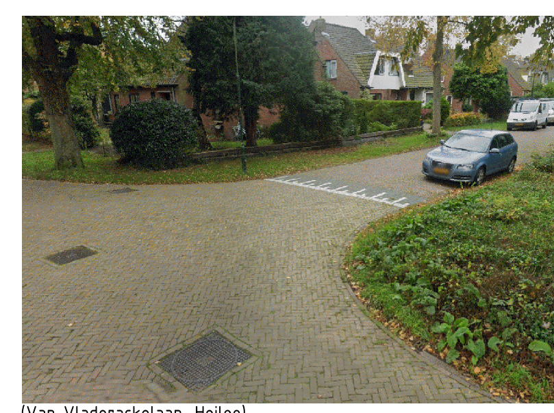
(Van Vladerackelaan, Heiloo)

Aan deze tekening kunnen geen rechten worden ontleend.